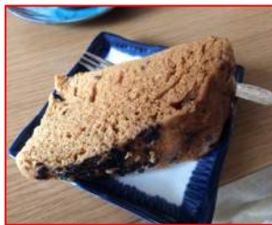
郷土料理「がんづき」

第2部では、市民活動センターたちかわの運営委員から、初めてボランティアに参加された時のきっかけや、現在行っている市民活動についてのお話を聞かせていただきました。