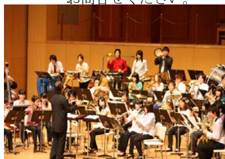
ふれあい ミュージック フェスティバル 2009の様子