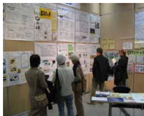
運営委員会で準備を重ね実施した 市民活動たちかわ祭2006