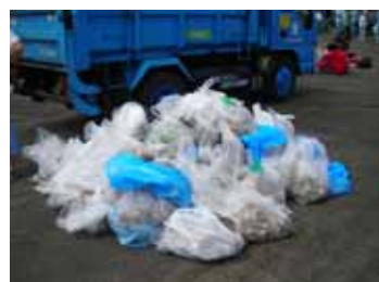
活動で集めた ゴミの山

情報をお寄せください！ みなさまからのご意見・掲載情報をお待ちしています。詳しくは電話またはメールにてご連絡ください