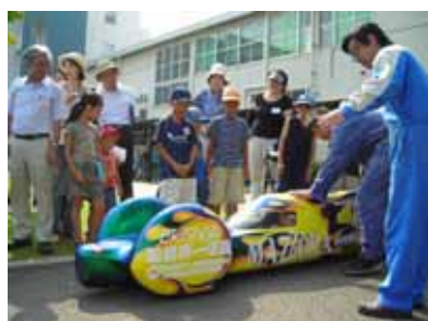
省エネカーの体験試乗