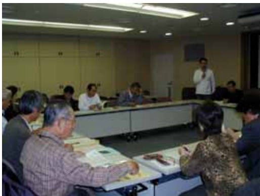
当日のNPO向けの学習会の様子

立川市は、他の福祉サービスは近隣市に比べ比較的充実していると言われていますが、移送サービスについては、障害のある人向けのサービス量は一定数あるものの、高齢者向けのサービスは、まだまだ不足している状況です。