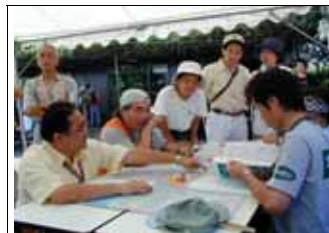
写真は当センター主催「個人向け」の啓発活動・・・9月12日(日)立川市防災訓練の一角にて。「帰宅困難者図上体験訓練」のシミュレーションを通して、具体的な被災の様子を具体的に考える事ができる。家族参加もあり好評だった。協力はNPO法人危機管理対策機構。

ひとつは 発災後数日以内 に「災害ボランティアセンター」を立ち上げ、市外からのボランティアや物資を市内各地域へ結びつけること(市の防災マニュアルにも記載)。ふたつ目は、 発災以前 に地域や個人の防災意識を高める啓発活動を、他の団体とネットワークを作りながら行うことです。発災時の訓練というより、健全な危機感を育てあうのが目的です。自治会単位でのワークショップ・啓発活動メニューの提案や災害弱者対策などを一緒に考えていきたいと考えています。