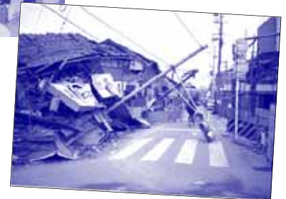
写真は阪神淡路大震災の時