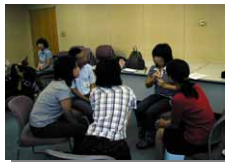
出会ったばかりだけど