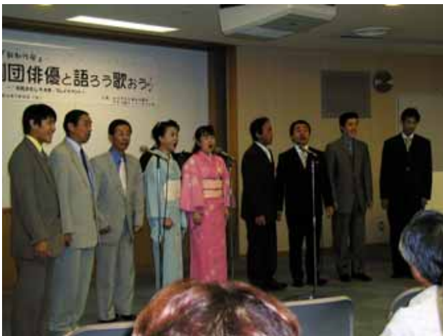
最初のプレゼントは歌で

7月18日(日)、女性総合センター・AIMにて市民おもしろ大学イベント「新制作座 劇団俳優と"語ろう""歌おう"」が行われました。市民おもしろ大学は、市民活動センターたちかわによる「市民の力で市民活動文化を創る」事業の一環として、市内外のいろいろな人材を発掘・紹介して豊かな地域社会の創造を目指すユニークな試みです。その「市民おもしろ大学」の開講イベントとして、7月29日(木)にアミュー立川(市民会館)で『泥かぶら』を公演する新制作座(八王子市)の俳優たちと参加した市民の交流会が開かれました。