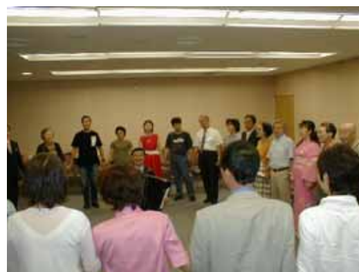
みんなで故郷を大合唱

交流会の最後に、劇団の俳優たちと参加者が手をつなぎ合い「故郷(ふるさと)」を大合唱しました。歌詞の最後にある「忘れがたき故郷(ふるさと)」「思いいずる故郷(ふるさと)」に立川市もなるように私たち自身が努力をしなければいけないと強く感じました。