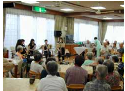
昨年のプレコンサートの様子 演奏に涙する方もいらっしゃいました。

演奏曲(予定) 青い山脈 夏の思い出 川の流れのように ハンガリー舞曲5番 …など