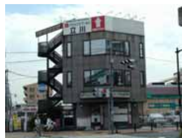
写真：ナカトクビル (いなげや立川幸町店隣り)

放課後クラブなごみ 放課後を暗くなるまで過ごせる安心の場所。(月・火・木・金15:30-19:00 水14:00-19:00 1時間 ¥735より)