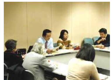
とりあえずどんな質問でも