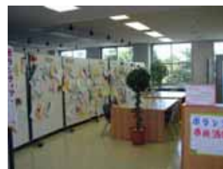
市民活動情報発信中！

* 情報発信についても情報コーナー・ホームページなどでお手伝いできることがございましたらご相談ください。