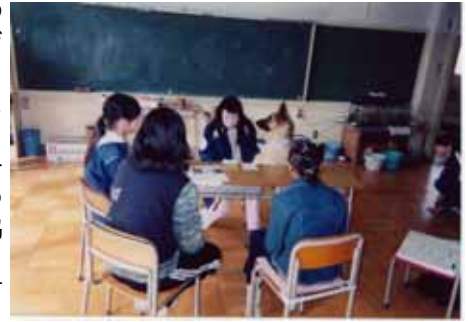
市内の小中学校でのひとこま