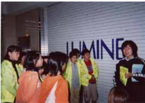
たくさん子どもボランティア

このコーナーでは、このまちのあれこれについてネタを提供します。 まちの中にはけっこういろんな出来事が・・。