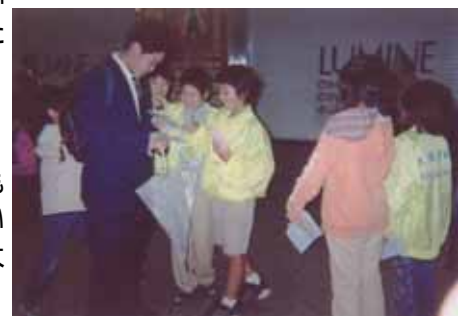
登校前にボランティア

朝の通勤時、ティッシュではなくチラシだけの配布です。ただでさえ手にとってもらうことは難しいですが、それに加え今年はさらに雨のため、手には傘も持っています。最初は子どもたちも気後れしますが、次第に積極性を発揮。受け取る大人も熱心な子どもたちの姿に温かく見守ってくれたもあらわれました。ご協力頂きましたみなさま。朝早くからありがとうございました。