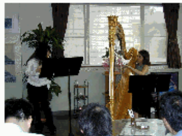
昨年のミニコンサート