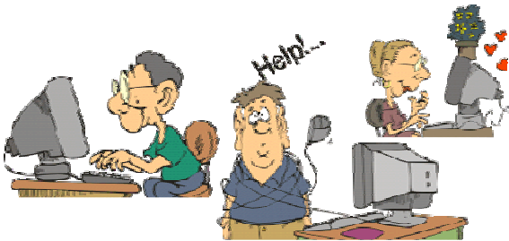
ウェブやメールでの相談も受けています

そんな折、損保ジャパンから中古パソコンの寄贈があり、これを使った講習会などができないかと市民の皆さまに呼びかけたところ、多くの市民有志が協力を申し出てくださり、ボランティア組織「たちかわパソコン倶楽部」が結成されることになりました。中古パソコンの活用についてはまだ検討課題ですが、まずは「パソコン相談会」から始めていくことになりました。