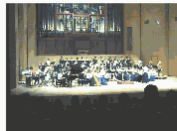
昨年の大ホールでのコンサート

情報をお寄せください！ みなさまからのご意見・掲載情報をお待ちしています。詳しくは電話またはメールにてご連絡ください