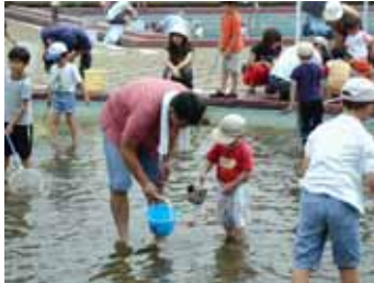
子供たちも真剣そのもの

砂川地域の大人たちが手を組んだ！子供にかかわる多くの団体から新たに構成された「立川市砂川地域3世代交流推進委員会」が実施の主体。自然体験・歴史探訪・工作教室でのものづくり等を実施し「遊び」をとおして親子で生活文化・地域文化を継承し、その中から子ども達が自ら「生きる力」を身につけ、人間性豊かに育っていくことを