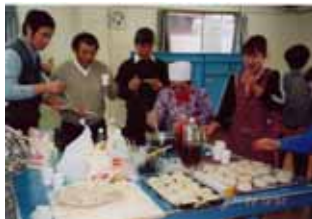
手づくり餃子の作り方。今日は帰国者の皆さんが先生です。