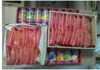
「Xmasプレゼントを届けることができました！」(他市)

立川でも以前よりこのフードバンクを活用して、ホームレスの方への支援をしている団体と、子どもの貧困に関心の高い団体や個人が、毎月定例会を開き、この仕組みを子育て世帯へも広げる取り組み