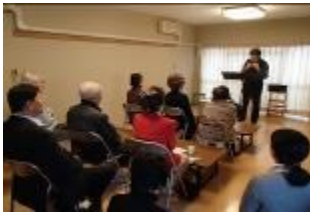
市との懇談会の様子(11月)。オカリナ演奏も催され、美しい音色に魅了されました。

住民同士、美味しいお弁当をいただきながら、和気あいあいとおしゃべりしたり、交流や情報交換の時間が持っています。