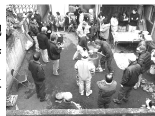
祝法人化も兼ねた今年の餅つき

会長は「小規模の自治会だからできた」「良い大家さんにも恵まれた」と仰いますが、3年間をかけて常に丁寧に話し合いを重ね、お互いの意見や心情に耳を傾け、納得を得られるように手間をかけて進行してきた様子が伝わってきました。ともすれば「速く決めればよい」「何度も話し合うのは面倒くさい」と雑になりがちですが、役員は丁寧に言葉を尽くして働きかけ、会員もそれに対してアンケートへの回答、説明会には足を運ぶ、などきちんと協力していることが伺えて、とても暖かい気持ちになりました。そしてもう一つ学んだことは、きづなを保つ工夫「笑い」です。行事をするにも楽しさやユーモアを伴って、一人ひとりへの配慮を尽くしているからです。自治会の年間行事のエピソードを伺って爆笑することが何度も。「地縁は結構楽しいものですよ」と周りに伝えたくくなりました。