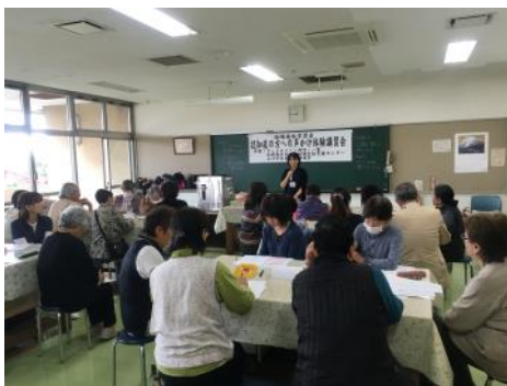
認知症の症状、接し方のポイント講座

しかし、“見守り”といっても具体的に何をしたら良いのやら…。そこで、グッドネイバー西砂一番の皆さんや地域の方と『認知症の方への声かけ体験講習会』を行いました。当日は、認知症の症状や声かけのポイントを学んだあと、困っている高齢者役の方に実際に声かけをしました。