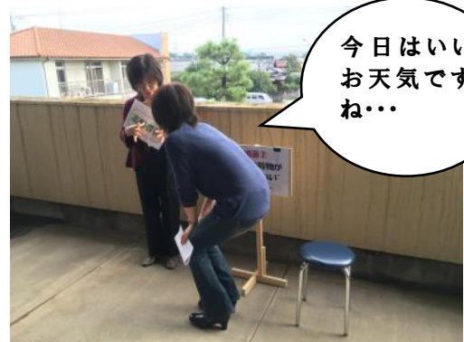
実際に高齢者役の方に声かけをしました

参加者からは、“難しかった”との感想の一方で、“日頃からの地域の関係づくりが大切”など、認知症の方の見守りを通じて地域を考えるきっかけになった方もいらっしゃいました。