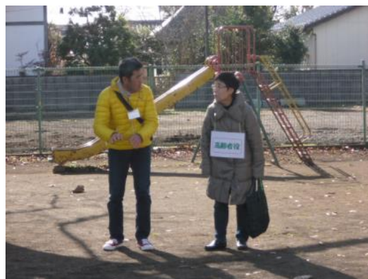
“どなたか、お探しですか？”