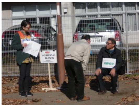
“寒いですね、どちらまで？”