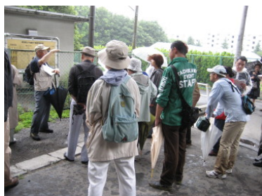
「自然！再発見 ～富士見町の自然と歴史・文化を訪ねる～」