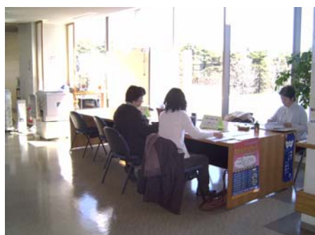
市民活動センターオープンスペース “予約は不要。打合せなどにご活用ください”