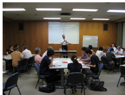
市民活動団体連絡会 講師を招いて「共感を生み出す発信力」学習会を開催