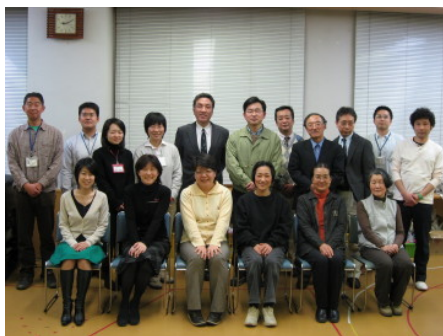
運営委員とセンタースタッフ

市民おもしろ大学、市民活動センターまつり、商工会議所との協働事業などを検討し実行する