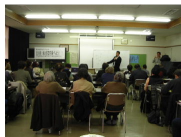
「立川発！旬の野菜を食べよう!! ～地産地消と食の安心・安全を考える～」