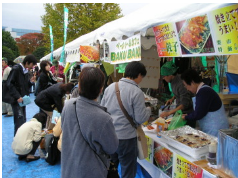
秋の楽市に25の市民活動団体が出店。 日頃、市民活動と縁遠い市民との貴重な出会いの場。活動費も稼ぎます。