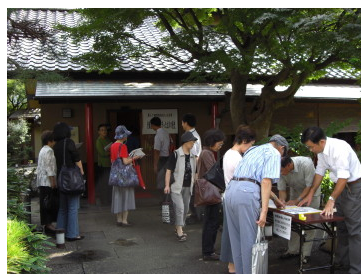
「老舗名物旅館が見守った立川の歴史」