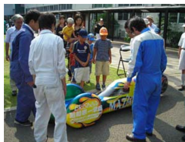
第13回「大人の社会科学見学第2弾～爆走われらのソーラーカー～」で車の説明をする先生と部員の皆さん