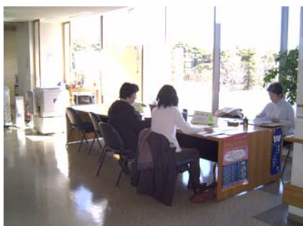
市民活動センターオープンスペース

・ボランティアルームしばざき(柴崎町 1-17-7 シルバー人材センター1 階/定員 10 名・机 5 台・イス 8 脚)