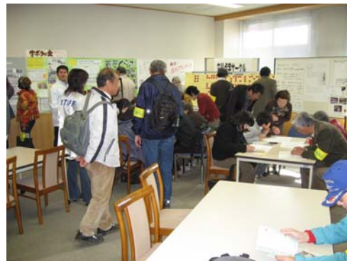
市民活動のきっかけづくりこと 企画されたイベント