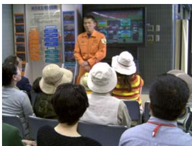
第12回「大人の社会科学見学第1弾～防災館での防災体験・ハイパーレスキューの見学～」で活動の説明をするハイパーレスキュー隊員