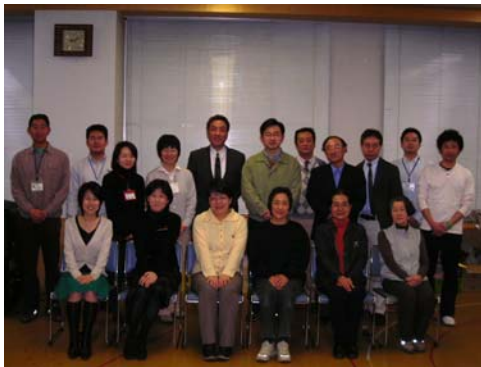
運営委員とセンタースタッフ

市民おもしろ大学、市民活動センターまつり、商工会議所との協働事業などを検討し実行する